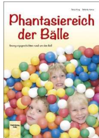
„Phantasereich der Bälle“ ISBN 978-3-7911-0289-4