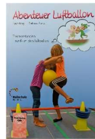
„Abenteuer Luftballon“ ISBN: 978-3791102962