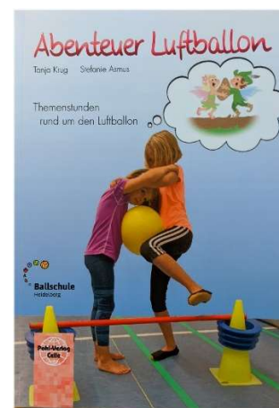
„Abenteuer Luftballon“ ISBN: 978-3791102962