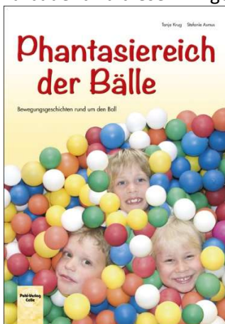
„Phantasereich der Bälle“ ISBN 978-3-7911-0289-4