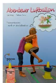
„Abenteuer Luftballon“ ISBN: 978-3791102962