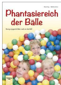
„Phantasereich der Bälle“ ISBN 978-3-7911-0289-4